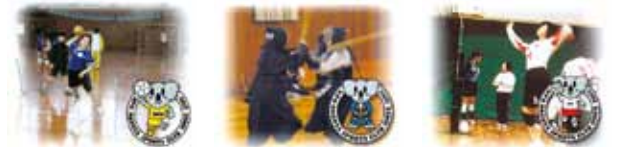
ハンドボールスクール 剣道教室 女性バレーボール