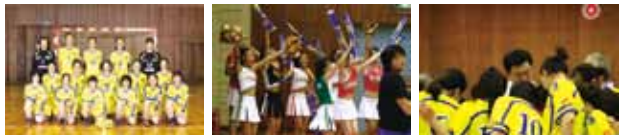
ハンドボール(HC名古屋)・剣道・女性バレーボールの運営